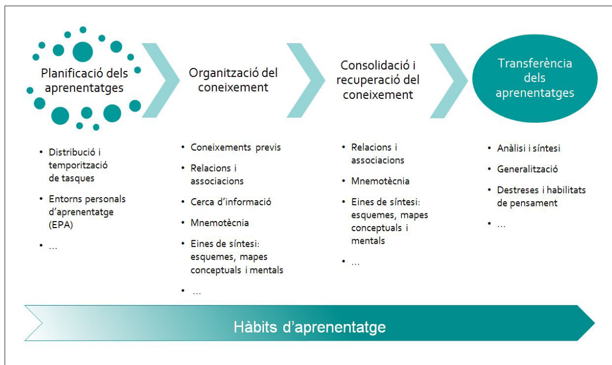
Figura 2. Continguts clau de la competència 2

L'equip docent i els equips de centre que intervenen en el procés d'ensenyament i aprenentatge han de preveure de forma coordinada, en la planificació de curs i dins de cada matèria i projecte, les diferents estratègies i hàbits concretats en les activitats per treballar els continguts clau d'aquesta competència.