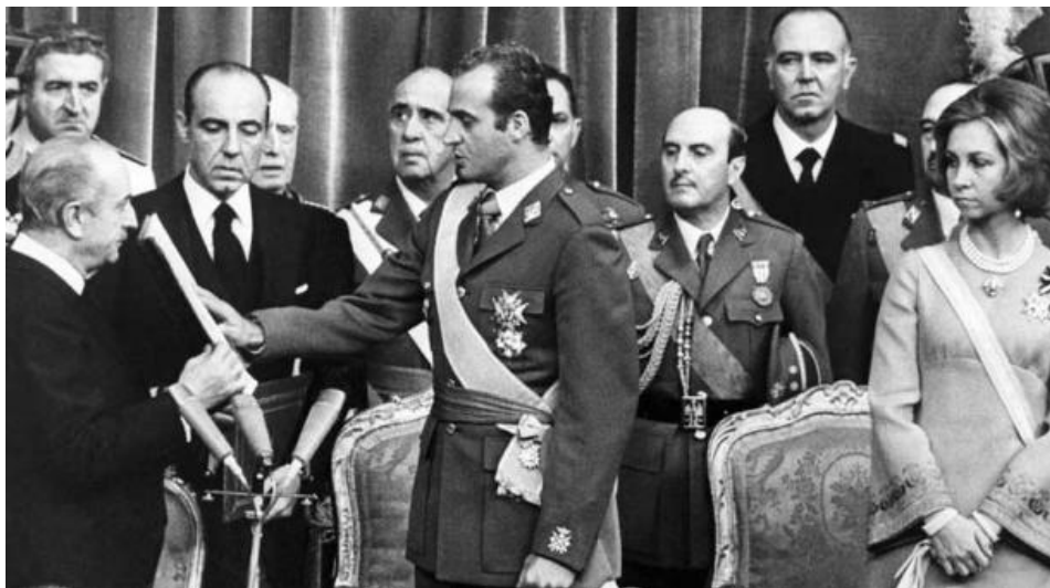
Jurament del rei Joan Carles I davant el president de les Corts (1975)