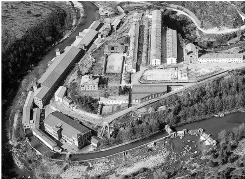
Vista aèria d'una colònia industrial (Viladomiu Nou, Berguedà)